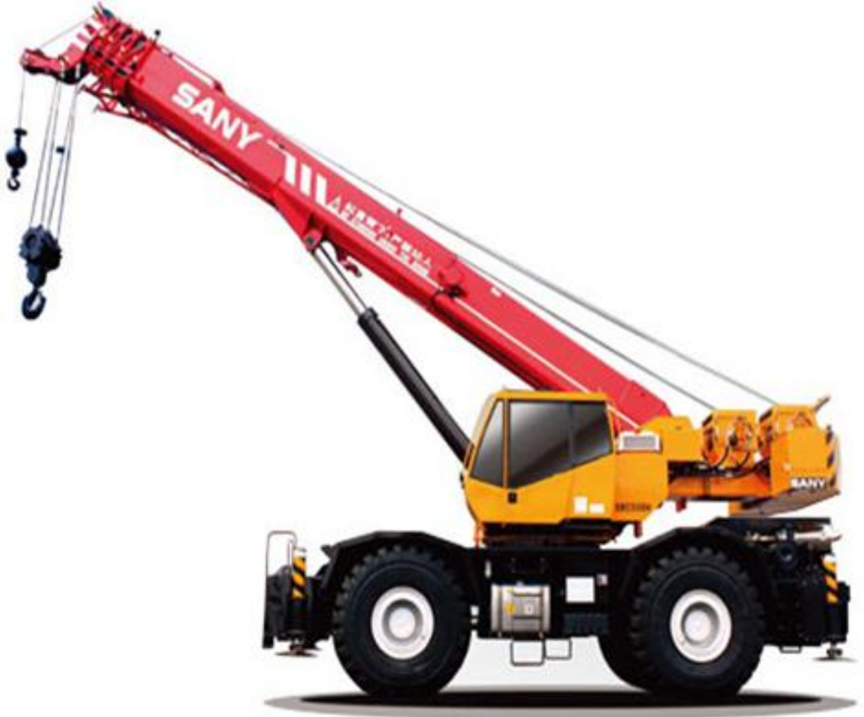
كرين على طريق و عوة SRC550H